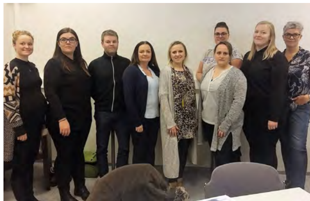
Pátttakendur í hæfnigreiningu fyrir starfsfólk upplýsingamiðstöðva á Akureyri.