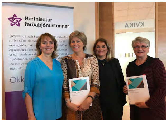
Frá undirritun samnings við Gerum betur um þjálfun í gestrisni.

Efnið ásamt leiðbeiningum um hvernig má nota það verður gert aðgengilegt á vef Hæfnisetursins, www.haefni.is og allt efnið verður opið öllum án endurgjalds. Efnið ásamt leiðbeiningum er á íslensku, ensku og pólsku.