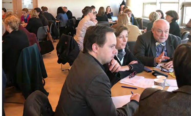
Af fundi um stefnumörkun fyrir nám í ferðapjónustu.