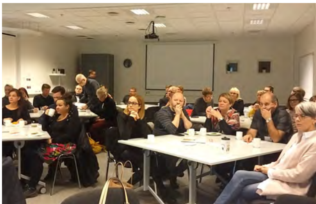
Fundað með fyrirtækjum og hagsmunaaðilum á Akureyri.