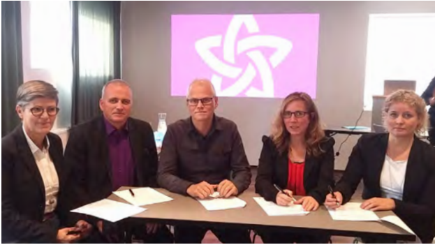
Frá undirritun samnings við símenntunarmiðstöðvar um tilraunaverkefni.