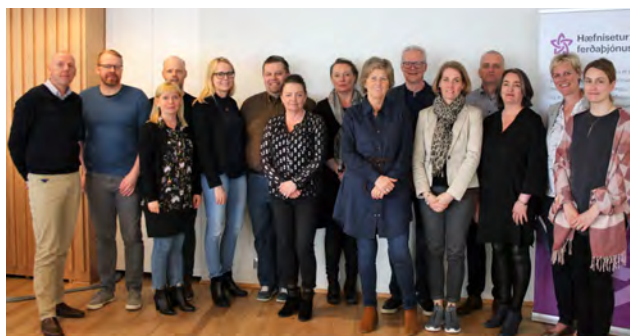
Stýri- og faghópur ásamt starfsfólki Hæfniseturs ferðabjónustunnar.